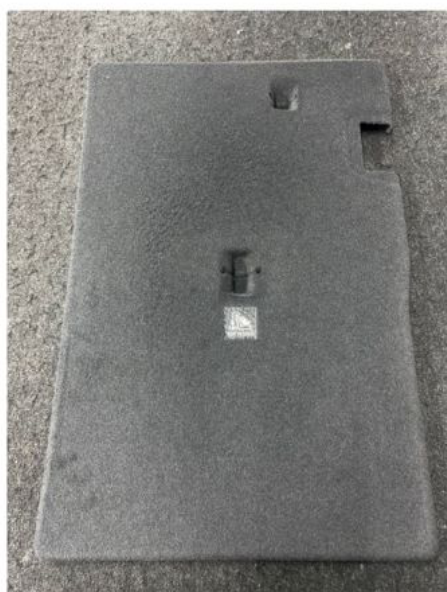
413,5 mm x 614 mm - 0,282 g