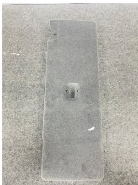
314,4 mm x 630,4 mm - 0,174 g